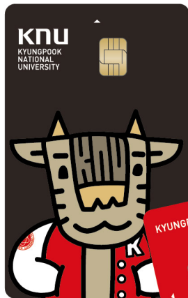
KYUNGPOOK NATIONAL UNIVERSITY NEW STUDENT ID CARD